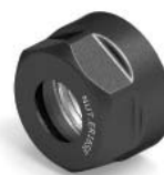
ER SE NUT