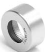
ER HS NUT