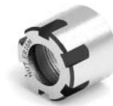
ER MINI NUT