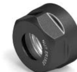
ER MINI SE NUT