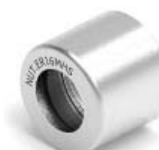
ER MINI HS NUT